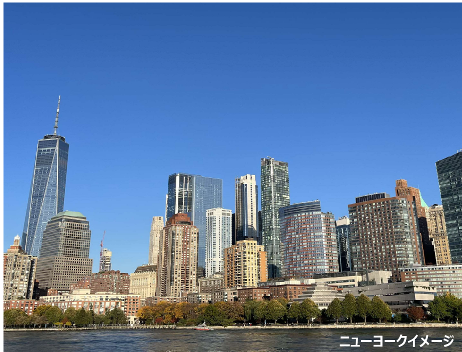
ニューヨークイメージ