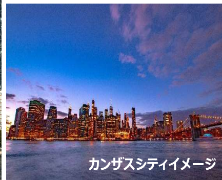
カンザスシティイメージ