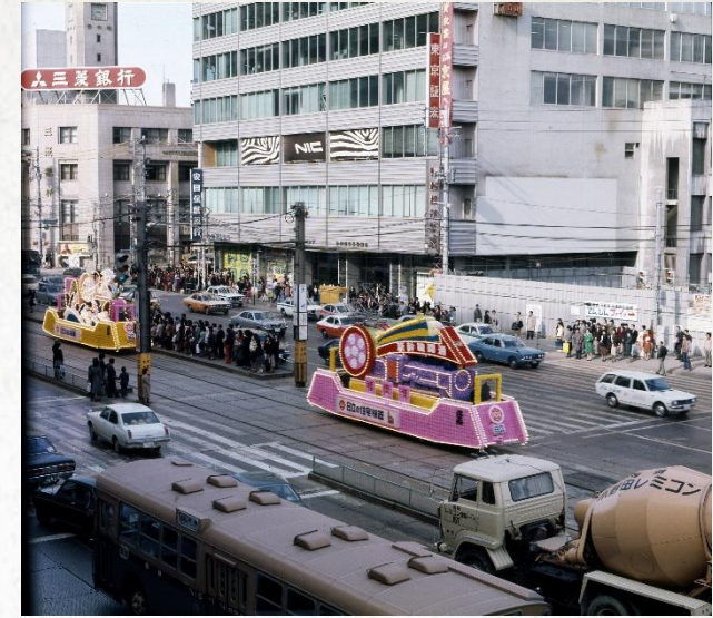
1975年 天神電停と福岡ビル