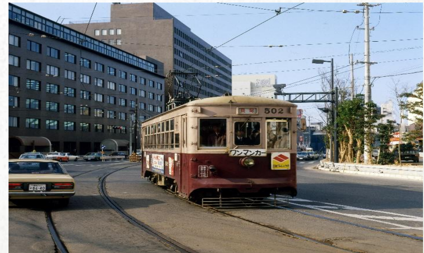
1978年 渡辺通一丁目交差点を進む路面電車