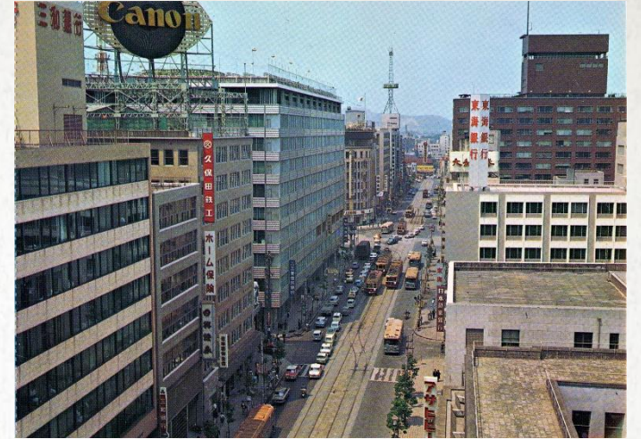
1965年 摩天楼と呼ばれた天神ビル街(現明治通り)