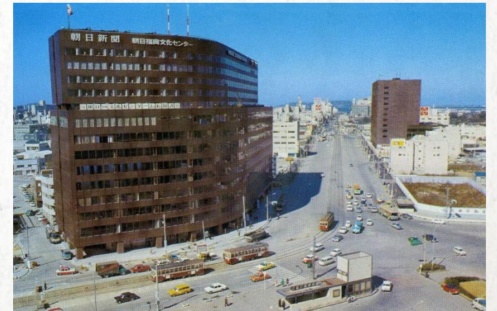
1970年 博多駅前に福岡朝日ビル完成