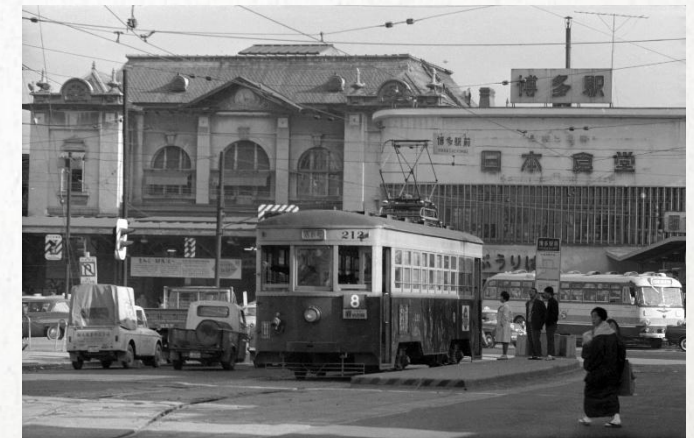
1962年 旧博多駅と路面電車