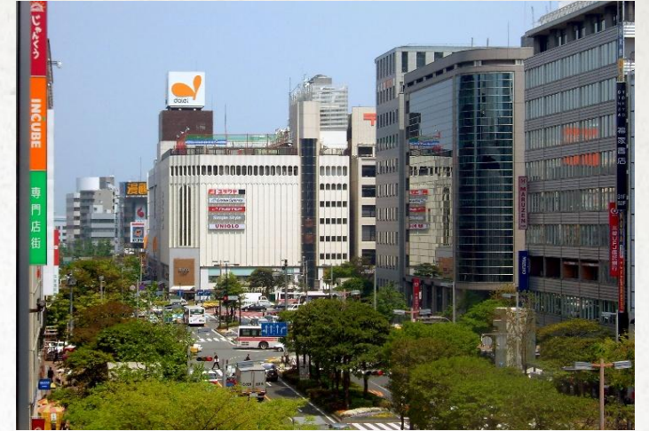
2006年 天神・渡辺通り