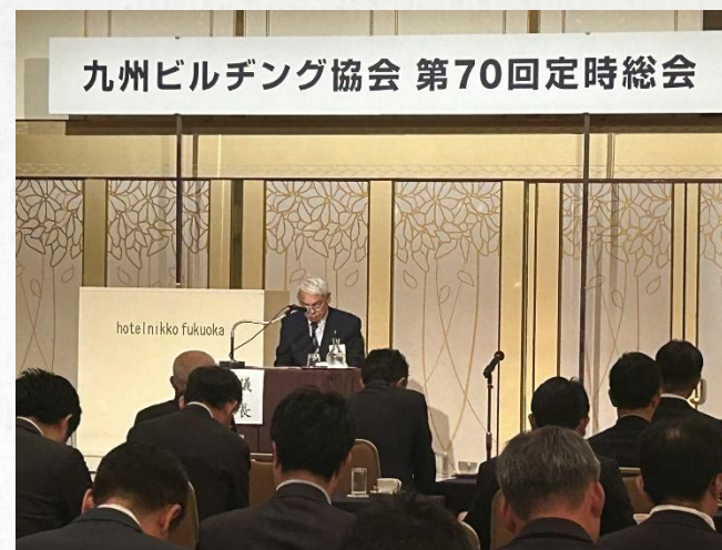
2024年5月 第70回 定時総会