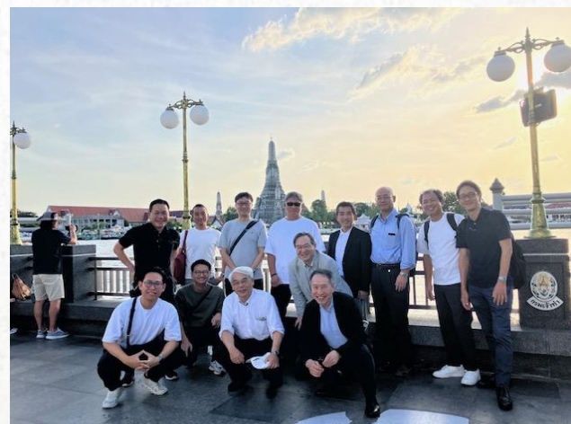
2024年11月 海外ビル視察(バンコク)