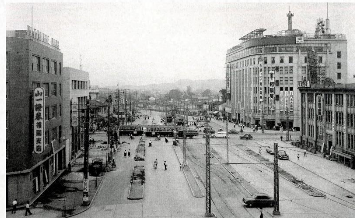
1956年 渡辺通りと天神交差点