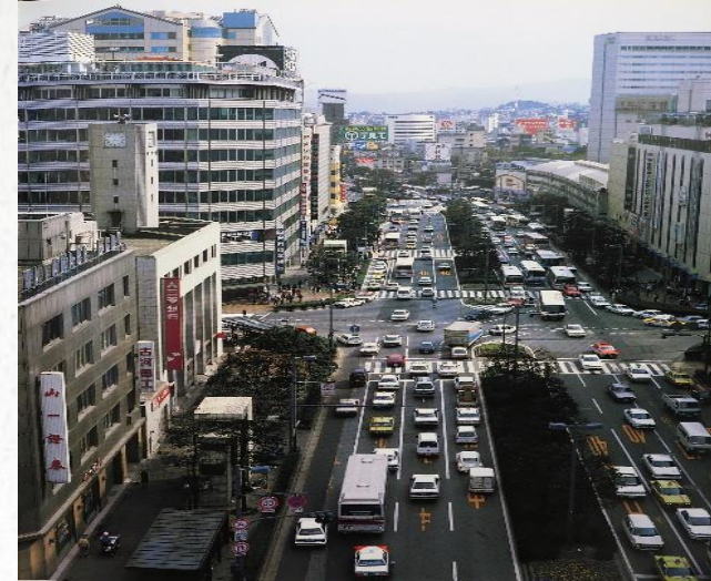
1989年 渡辺通りと天神交差点 写真集「福岡百景」より