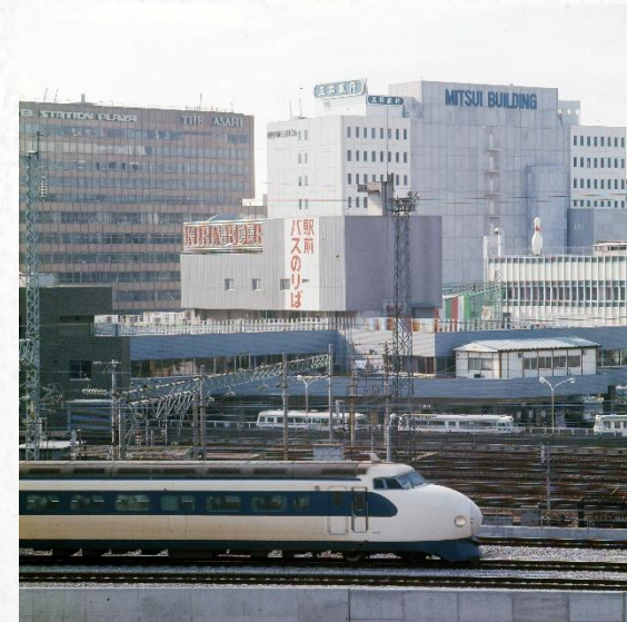
1975年 山陽新幹線博多全通