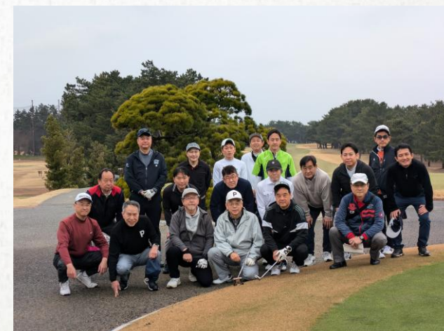
2025年3月 第365回 ゴルフ会