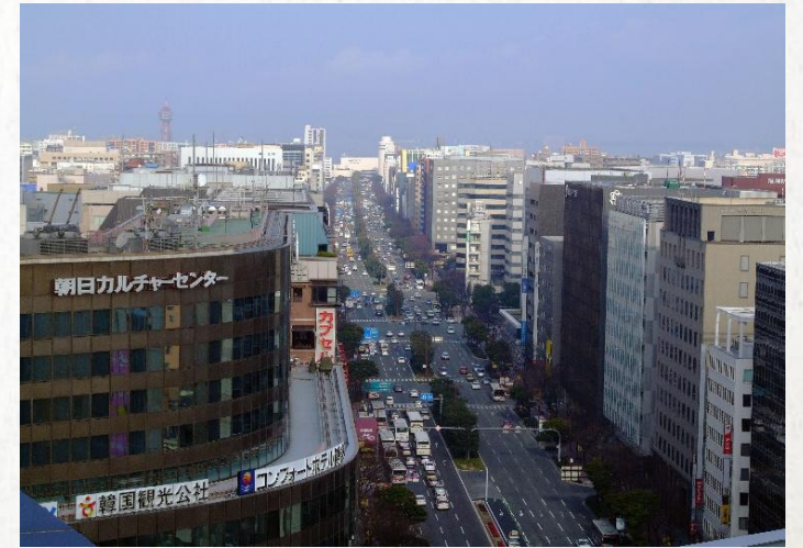
2011年 JR博多シティ屋上から大博通りを望む