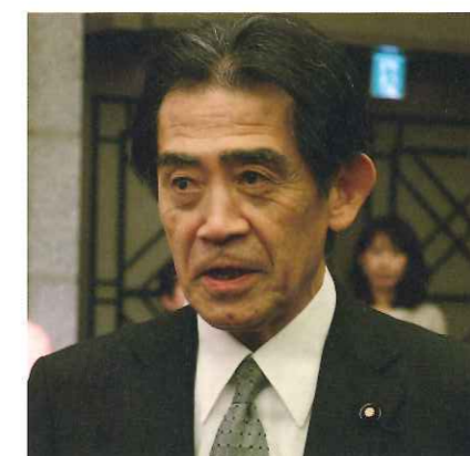
逢沢一郎・衆議院議員