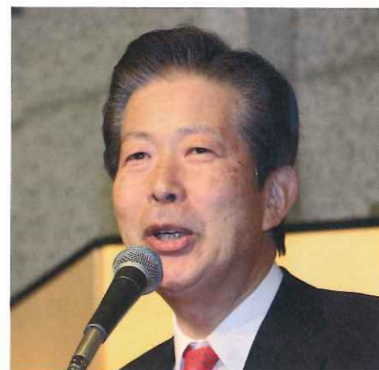
山口那津男・公明党代表