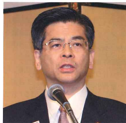
祝辞を述べる石井啓一・国土交通大臣

場環境は、旺盛な不動産需要を背景に商業地の地価は総じて上昇傾向を示し、企業収益の改善と働き方改革の進展でオフィスの空室率は低下傾向が続き、賃料水準も上昇してきている」との認識を示した上で、「さらなる経済成長に向け、東京など大都市ではグローバルな経済圏を中心として、また地方都市については地域経済の牽引役として、世界から「ヒト・モノ・カネ・情報」を呼び込むことが期待されている。とりわけ、都市の中核をなすオフィスビル等の建築物は都市インフラとして、また経済インフラとして重要な役割を担っており、建築物の質の向上が求められている。今後、ビル関連業界の皆さんと