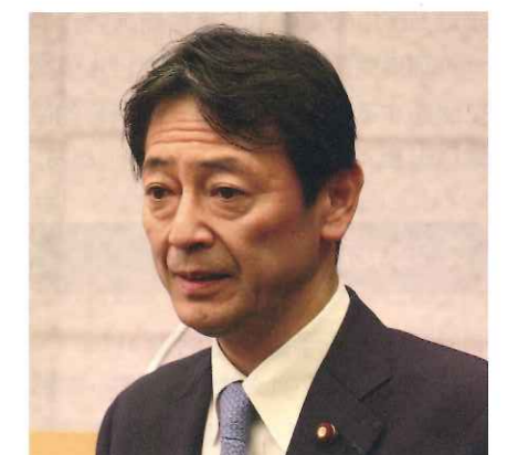
工藤彰三・国土交通大臣政務官