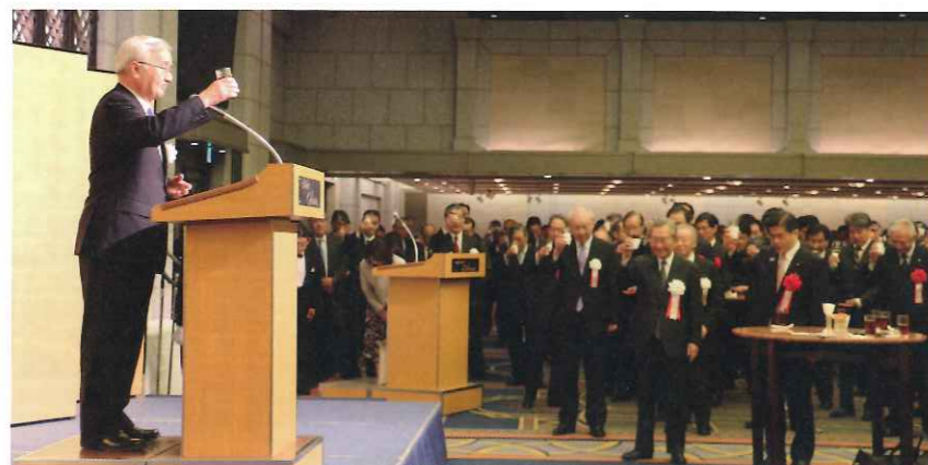
中井副会長による乾杯の様子