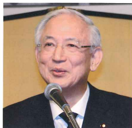
井上義久・公明党副代表