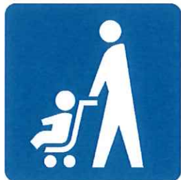
ベビーカーマーク

ベビーカー使用者が安心して利用できる場所や設備（エレベーター、鉄道やバスの車両スペース等）を表しています。