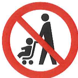
ベビーカー使用禁止マーク

ベビーカー使用者が安心して利用できる場所や設備（エレベーター、鉄道やバスの車両スペース等）を表しています。