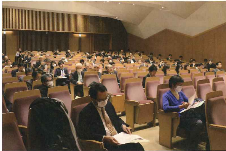
熱心に聴講する参加者

言及。この中で、「環境性、快適性等の品質に優れた不動産を適正に評価する」、「長時間労働を是正し、働く方の健康を確保する」といった『はたらく人の健康増進』と『快適性等に優れた不動産への投資の促進』が明文化されたことに触れた。