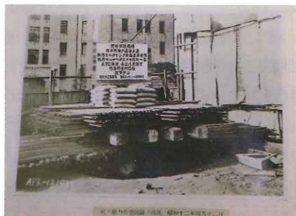
杭の耐力荷重試験の様子