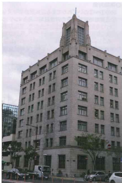
神港ビルディングの外観

神港ビルディングは鉄骨鉄筋コンクリート造地下1階地上8階建てで、建築面積が521.112坪、建築総面積が4,346.016坪の規模。外壁は花崗岩が貼られ、屋上の南東角に建つアールデコ調の塔屋が特徴的な建