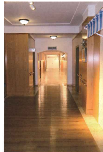
改修された地下1階

「骨董的価値を残しつつも現在の実用に充分耐え得る」と顧客からも評価されるように「3年から5年タームで修繕計画を立て、