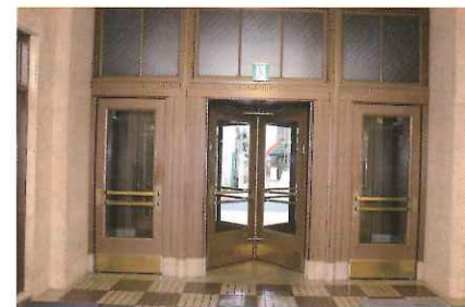
多くの来館者を迎えてきた回転扉

維持・管理及び機能改善に努めている」(中井氏)というように、神港ビルディングの建物内に入ると、古さを感じさせない。照明はLED化が施され、トイレは全自動の最新型にリニューアルされている。