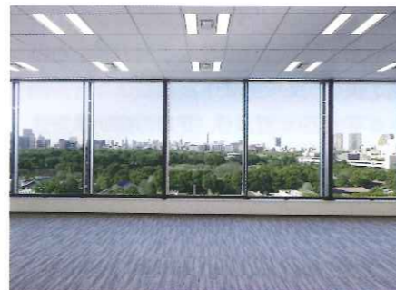
基準階オフィス皇居側眺望

間以上の発電機運転を可能にするるとともに、デュアルフェーゼル型ガスタービン発電機を設置し、災害時の事業継続をバックアップします。更に、事故や災害等が発生して電力供給が遮断された際に、本建物及び大手門タワー・JXビルの非常用発電機から、本建物内の丸の内熱供給株式会社による地域冷暖房サブプラントに電力を供給することで、一定条件のもと、冷水供給を受けることができるシステムを構築し、これにより、真夏の災害発生時の事業継続をサポートします。