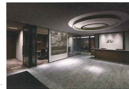
プレミアフロアレセプション

7階には、サービス機能付小規模オフィス「The Premier Floor Otemachi」（ザ・プレミアフロア大手町）を整備。1フロア約1,030坪を最小40坪台からの小規模オフィスに分割し、共用の受付や会議室、多様なサービスをパッケージにして提供する新たなオフィスサービスです。当社が推進する「成長戦略センタープロジェクト」の実施拠点である「EGG JAPAN」や「グローバルビジネスハブ東京」からの成長企業、小規模ながらSクラスビルを望む国内外の有力企業のニーズに対応しています。