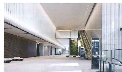
オフィスエントランス

店舗（1階・B1階）、地域冷暖房施設（B5階）、保育所（2階）、駐車場（B2,B3階）等から構成されています。