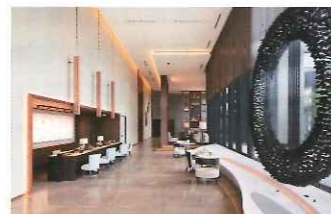
アスコットロビーラウンジ

「アスコット丸の内東京」が本年3月30日に開業致しました。運営はシンガポールに本社を置く、世界28カ国で30,000室を超えるサービスアパートメントの所有・運営を行うアスコット社（The Ascott Limited）が担い、その最上級ブランド「アスコット」が日本初の出店となります。客室総数130室の本施設は、全室38㎡以上のゆったりとした客室面積に加え、家具、家電、キッチン等を備え、滞在したその日から自宅で暮らしているかのように快適な生活が始められる施設としており、職住近接のビジネスニーズに対応しています。また、ホテルとして1泊からの短期滞在も可能であり、観光需要にも対応します。