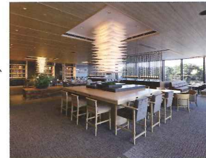
インペリアルラウンジ

2階オフィスサポートフロアには、皇居の緑と水の景観が広がるオフィス就業者専用ラウンジ「PARK LOUNGE」、及び店舗や保育所（計約500坪）を整備。ラウンジ空間の他にも、フィットネス、皇居ランニング後の利用も想定したシャワールーム、コンセントレーションブース、仮眠室等、多様な空間を備え、働き方や就業時間前後の過ごし方に幅を持たせる機能を提供し、職場から離れたサードプレイスとして就業者の生産性向上をサポートします。