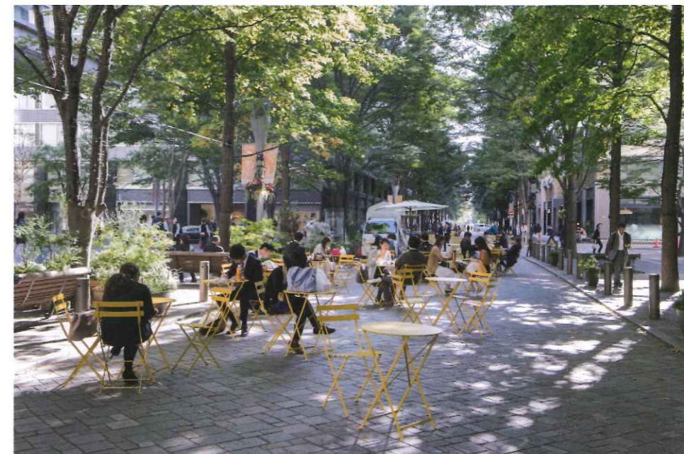
公的空間を活用したエリアマネジメント活動

本年9月に発表された東京都の「都市づくりのグランドデザイン」では、「エリアマネジメントに関する現行制度の充実とともに、東京の特性を踏まえたBID (Business Improvement District) 制度や区市町村による取組みの支援策の検討など」が示されており、速やかに具体化を進められたい。特に、上記で言及されている「東京版BID