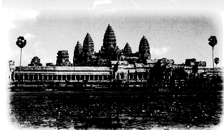
アンコールワット(イメージ)