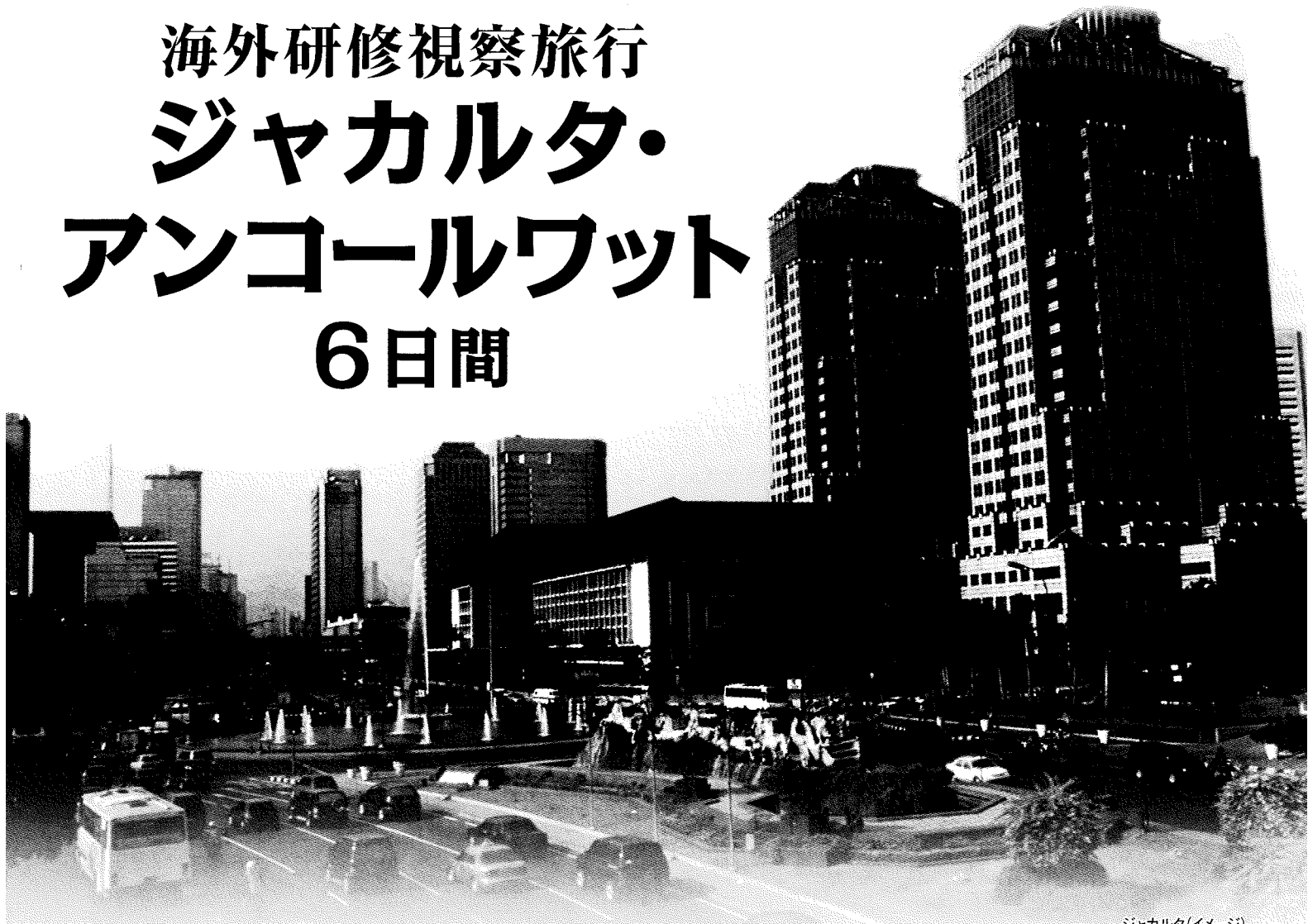
ジャカルタ(イメージ)